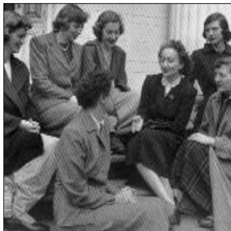
Alba de Céspedes, Aprile 1950

Un "intreccio" dunque il mio di oggi, non casuale, ma armonioso, e nella certezza che questa ri-pubblicazione darebbe a loro gioia, e non solo. (f. c.)