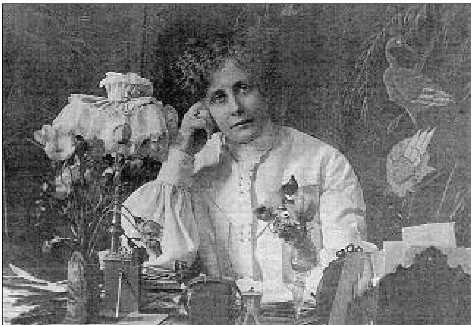
Amelia Rosselli

nero uccisi a Bagnoles-de-l'Orne in Francia nel 1937, per mano dei Cagoulard, sicari francesi assoldati dai fascisti italiani.